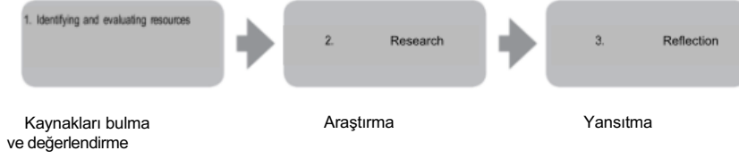
Şekil 3 Araştırma projesi

Öğrenciler, araştırma projeleri için serbest bir konu seçebilir ve kendi inisiyatiflerini kullanma noktasında teşvik edilirler. Öğrenciler konularını öğretmenlerinin rehberliği ve onayı ile seçmelidir. Öğretmenler çalışmaya başlamadan önce konuyu ve araştırma sorusunu onaylamalıdır. Araştırmayı destekleyecek yeterli kaynakların olması ve araştırmanın iç değerlendirme kriterleri ile değerlendirilebilmesi çok önemlidir. Öğretmenler ayrıca öğrencilerin, araştırma yaparken, örneğin hassasiyet gösterme veya gizliliğe saygı gösterme gibi ilgili etik hususlar hakkında farkındalığa sahip olmalarını sağlamalıdır.